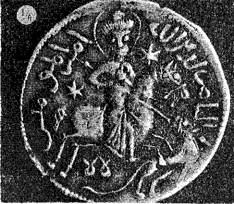
(Resim : 1/A)

YÜZÜ : Sultanın bizzat kendisi olduğunu tahmin ettiğimiz, dörtnala koşmakta olan atın üzerinde arslan avlayan bir süvâri resmi görülmektedir. Süvârinin sol tarafında : "Emir-ül mü'minin", sağ tarafında : "En-Nasır Lidin-illâh" ibâresi yer almaktadır.