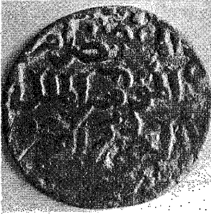
(Resim : 3/A)

Hisnkeyfa ve Amid Artukluları meliği Mesud Rükneddin Mevdûd'un, Alâeddin Keykubad I adına bastırıldığı sikkenin ön yüzü.