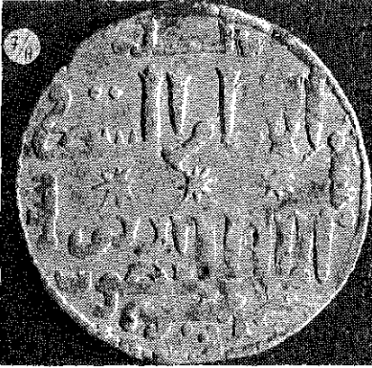
(Resim : 7/A)

Çapı : 21 m. Ağ : 2.90 gr. ARKA YÜZÜ : Es-Sultan ül-muazzam Keykubad bin Keyhüsrev. Etrafında : Bi Düneysir sene duribe haza el dirhem. (13)