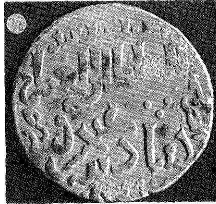
(Resim : 7/B)

Artuk Arslan'ın, Alâeddin Keykubad I adına bastırđıđı 626 Düneysir darp yerli sikkesi.