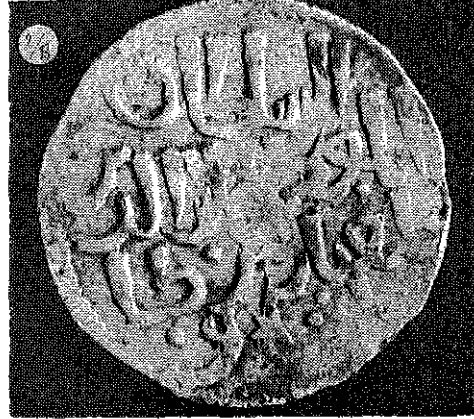
(Resim : 2/B)

Ermeni Tekfur'unun Alâeddin Keykubad I adına bastırıldığı gümüş sikkenin Ermeni harfleri ile yazılı ön yüzü.