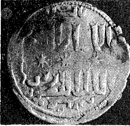
(Resim : 6/A)

Mardin Artukluları hükümdarı Artuk Arslan'ın, Alâeddin Keykubad I adına bastırıldığı 625 Düneysır darp yerli sikkesi.