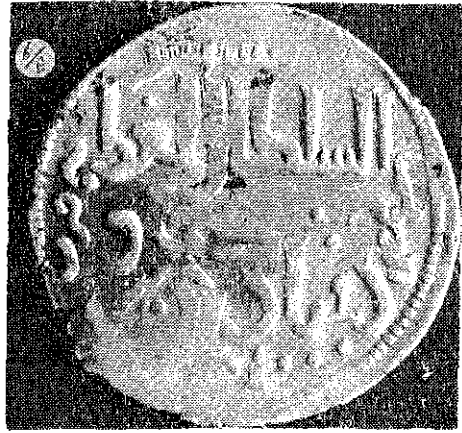
(Resim : 6/B)

Mardin Artukluları hükümdarı Artuk Arslan'ın, Alâeddin Keykubad I adına bastırıldığı 625 Düneysır darp yerli sikkesi.