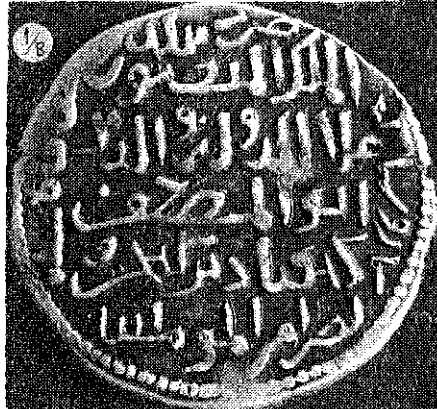
(Resim : 1/B)

Çevresinde : Duribe bibelde Tokat cne saman ve sittemae (H/608). (2)