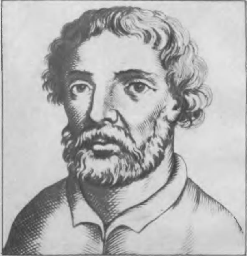
Stenka Timofevič Razin (1630-1671)