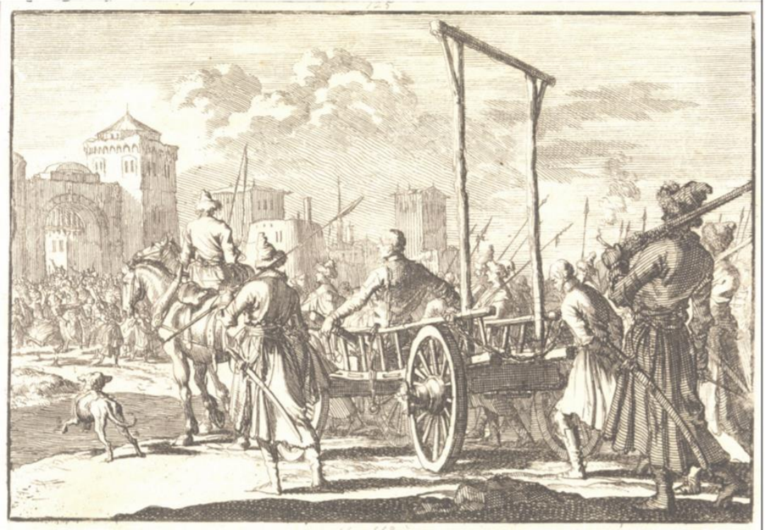
Razin kardeşleri Moskova'ya getiren araba (1630-1671)