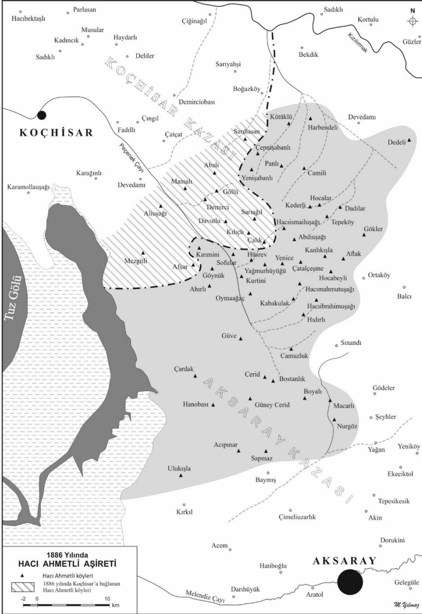
Harita II: 1886 Yılında Hacı Ahmetli Aşireti