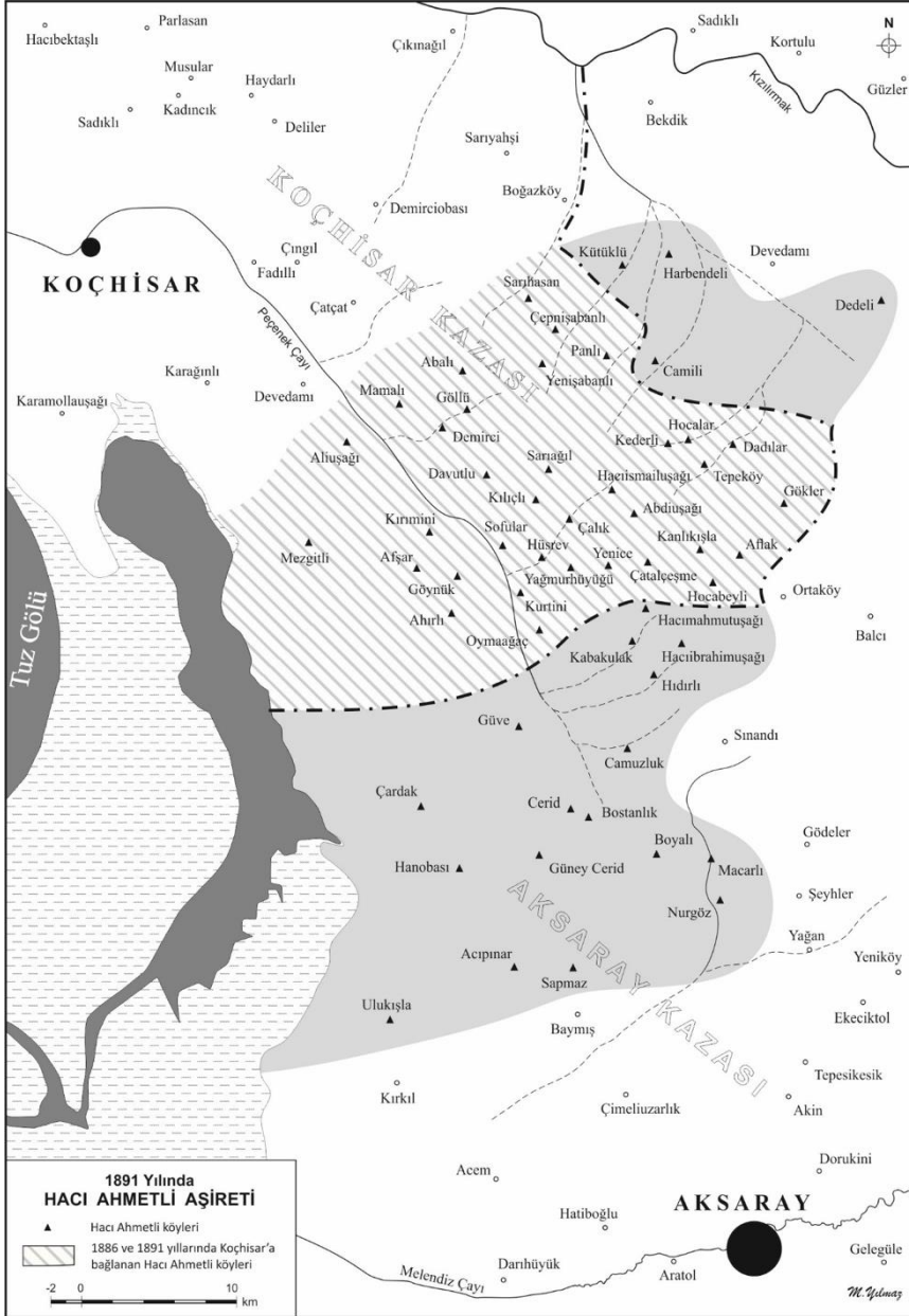
Harita III: 1891 Yılında Hacı Ahmetli Aşireti