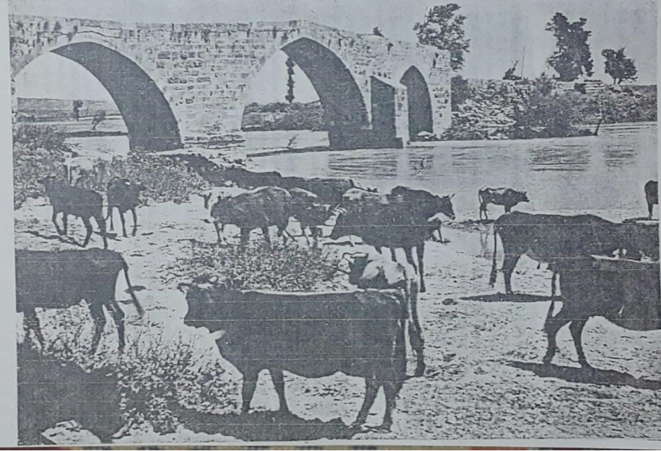
Res III: XX. Yüzyılım Ortalarında Köprü Çay Köprüsü'nün Görünüşü (Burhanettin Onat, "Coğrafya", Turistik Antalya , haz. Antalya'yı Tanıtma ve Turizm Derneği, Başbakanlık Devlet Matbaası, Ankara 1952, s. 24.