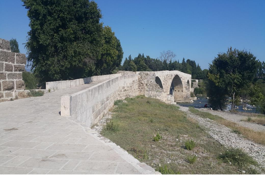
Res V: Günümüzde Köprü Çay Köprüsü (Sultan Alâeddin Köprüsü-Pazar Köprüsü) (9 Temmuz 2018)