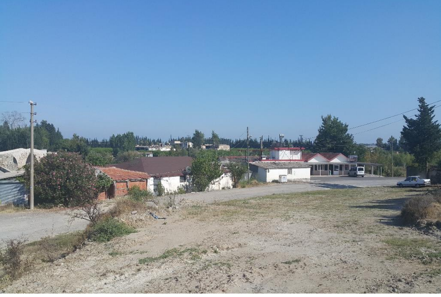
Res IV: Günümüzde Köprü Han ve Köprü Pazarı Alanının Görünümü (9 Temmuz 2018)