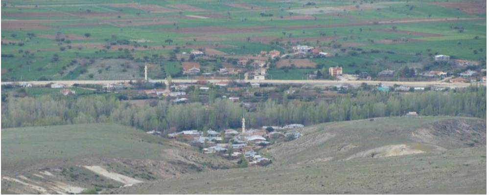
Foto 6. Tarihi yolun kenarında kurulan Yunuslar köyünün yerleşim sahası ve dokusunun genel görünümü. Fotoğraf Kale Tepe'nin batı yamacından alınmıştır.

Ramsay, Yunuslar köyünün yerinde Vasada adında piskoposluk merkezi bir yerleşmenin bulunduğunu belirtir. Burada büyük bir kilise harabesinin olduğunu ve bugün kullanılan Yunuslar adının da kiliseye; Aya Yohana (St. Jean İoannes) atfen verildiğini ileri sürmektedir. Yani O'na göre Yunuslar'ın kökeni Yohanaşlar'dır. 44 Fakat bu görüş doğru değildir. Çünkü birincisi, Yunuslar köyü, bugünkü yerinin yaklaşık 3 km kadar kuzeyinde idi. Haritalarda buraya halen "Eski Yunuslar" açıklamasının yazıldığı görülür. Dolayısıyla Yunuslar köyü bugünkü yerine daha yakın bir dönemde taşınmıştır. Başka bir ifadeyle Yunuslar yer değiştiren bir yerleşmedir . Köylüler, Yunusların iki defa yer değiştirdiğini söylemektedir. İkincisi, 1583/991 tarihli Akşehir Sancağı İcmal Defteri'nde Yunuslar Köyü'nün adı mevcut şekliyle geçmektedir. 45 Kısacası köyün adında herhangi bir değişiklik de söz konusu değildir. 46