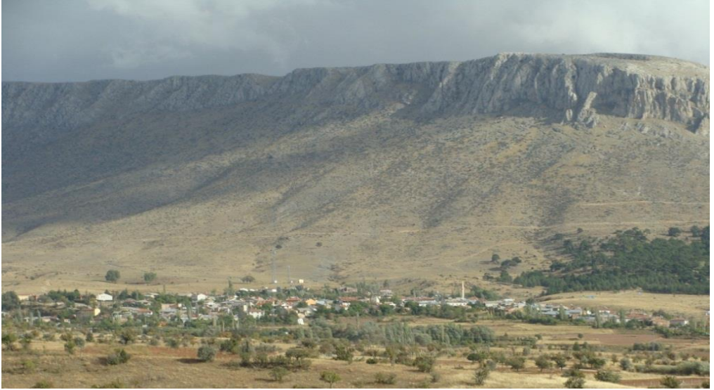
Foto 8. Kızılören, aynı adı taşıyan dağın kuzeybatı eteğinde kurulmuş eski bir yerleşmedir.

Konya'nın Meram ilçesine bağlı olan Kızılören, aynı adı taşıyan dağın (Gemrekbaşı da denilir, 2193 m) kuzeybatı tarafında, 1450-1530 m yükselti basamağında, eğimli yamaçlardan havza tabanına geçişi teşkil eden az eğimli yüzeyler üzerinde ve su kaynaklarının (Çoka Suyu) yanında, adının da işaret ettiği üzere eski bir yerleşmenin yakınında kurulmuştur (Foto 8). Günümüzde Konya - Beyşehir - Şarkikaraağaç karayolundan yaklaşık 1.5-2 km içeride kalan yerleşmenin adı 10 Temmuz 1964 tarih ve 11750 sayılı Resmi Gazetede yayınlanan kararla Kızılviran'dan Kızılören'e değiştirilmiştir.