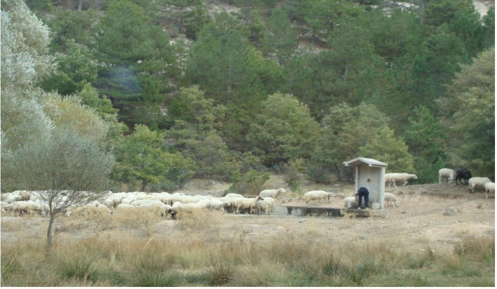
Foto 14. Yamasökendamları yakınında çoban çeşmesinde sulanan bir koyun sürüsü.

mastarından çıkmıştır. 66 İzbırak, yaylayı; dağlık bölgelerde kışın geçilmesi güç, yazın serin olan yüksek yerlerdeki hayvan otlatma yeri olarak tanımlar. 67 Sanır'a göre; hayvan yayılan, otlatılan yer anlamındaki yaylak veya yaylağdan gelen bir sözcüktür. Yaz mevsiminde hayvanlarla çıkılarak bir süre kalınan dağ otlağıdır. 68 Yaylacılık ise, yayla adı verilen yerlere sıcak aylarda geçici olarak göçme olayıdır. 69 Ülkemizde yaylacılık oldukça eski bir beşeri faaliyettir. Yayla bu faaliyetin yapıldığı yerdir.