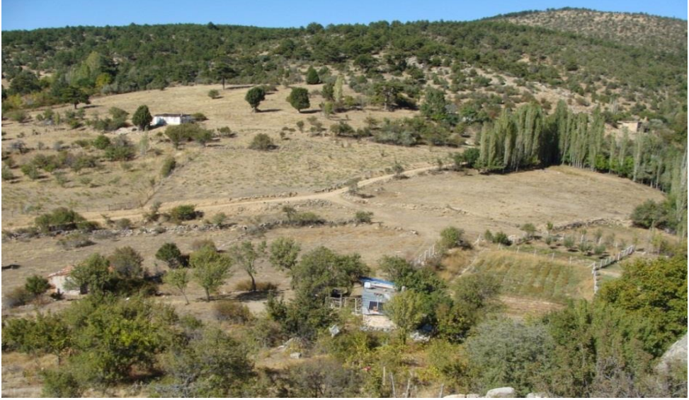
Foto 5. Kale Tepe Mevkii'nde Hititlerden başlayarak bugüne kadar kesintili ve farklı şekillerde de olsa yerleşmenin devamlılığı söz konusudur.

Kale Tepe'nin kuzey eteği ile hemen kuzey kesiminde yer alan Ballıkaya Yaylası'nda toplam 7-8 haneden oluşan küçük bir yerleşme nüvesi mevcuttur (Foto 5). Birbirinden nispeten uzakta yer alan evlerden 5-6'sı terk edilmiş, ikisi de dönemlik ikamet olarak kullanılır. Bu haneler tarım ve hayvancılıkla meşguldür. Genellikle bahçe-meyve tarımı yapılır. Netice itibari ile yukarıda verilen bilgilerden, Kale Tepe'de Hitit döneminden başlayarak bugüne kadar kesintili ve farklı şekillerde de olsa yerleşmenin devamlılığı tespit edilir.