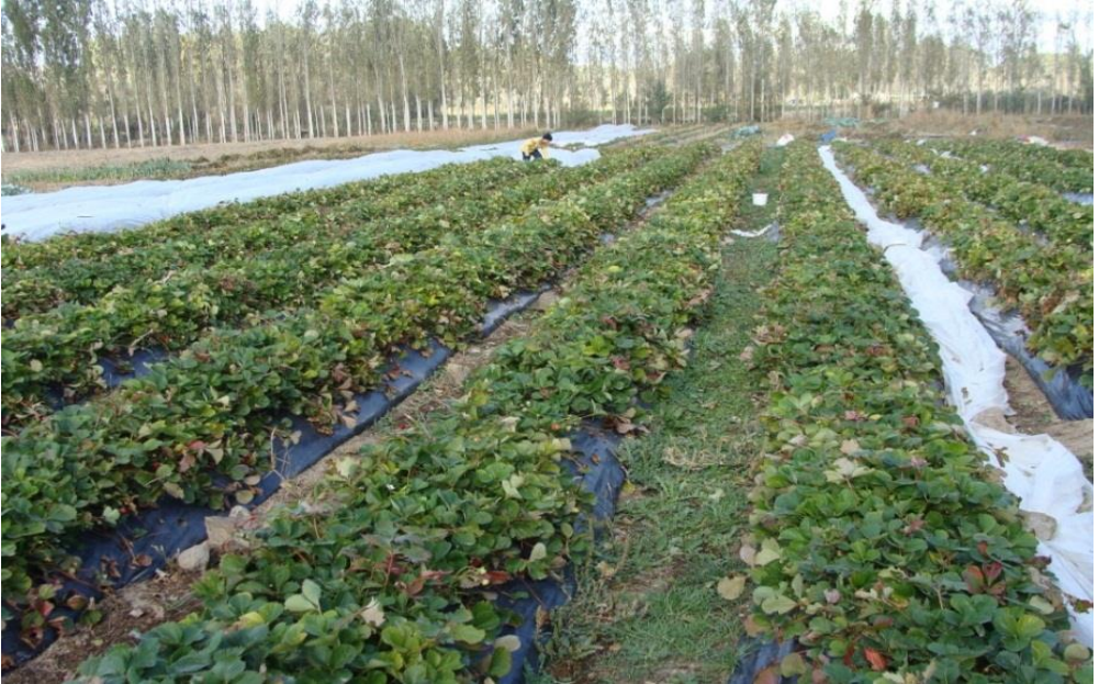
Foto 11. Araştırma sahasında tarımına yakın zamanda başlanan çilek bahçelerinden biri (Sağlık Köyü).