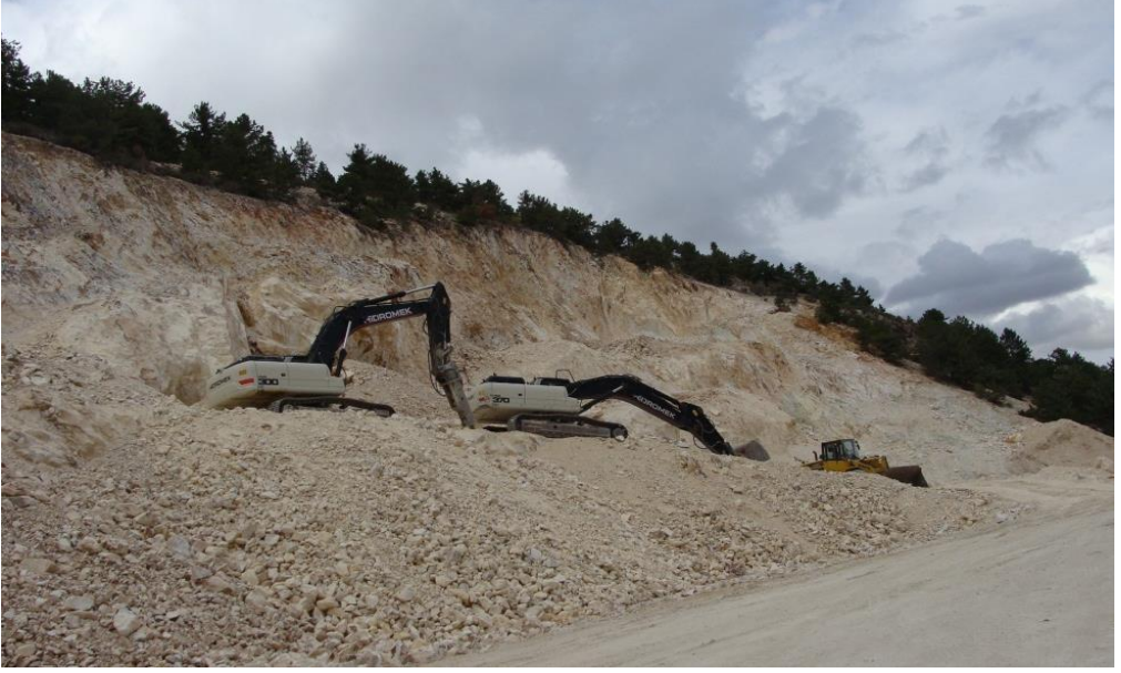
Foto 12. Sağlık'ta Bağırsak Boğazı'nın güney tarafında özel bir şirket tarafından işletilen maden sahası.