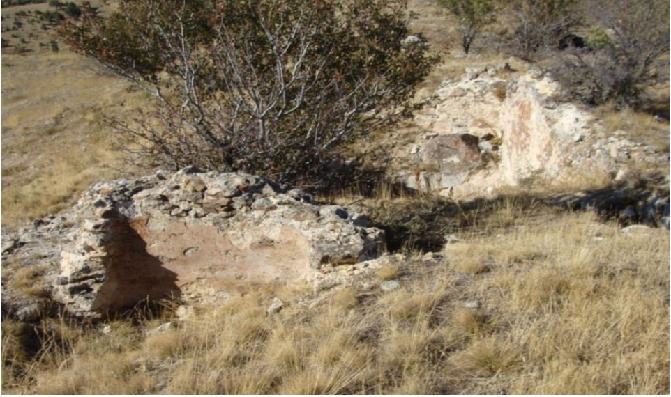
Foto 3. Kale Tepe'nin yüksek kesimlerinde yer alan yapı parçalarından bir görünüm.

Kalıntılar nedeniyle burası ve yakın çevresi, 4 Kasım 2002 tarih ve 4745 sayılı ile Asarkale Ören Yeri adıyla I. derece arkeolojik ve doğal sit alanı olarak tescil edilmiştir. Balkayalar Kalesi seramik parçaları, genellikle krem renkli hamurlu, koyu gri renkli astarlı, taşçık, kireç, mika katkılı, iyi pişkinlikte ve çark yapımıdır. Seramik formları Karatepe – Aşitawanda Demir Çağı malzemelerine benzer niteliktedir. 25 Balkaya keramikleri genel olarak açık ağızlı görünümle MÖ II. bin yılın form özelliklerini de gösterir. 26 Keramik buluntulardan Geç Tunç Çağı'ndan itibaren Kale çevresinde yerleşmenin olduğu kabul edilir. 27