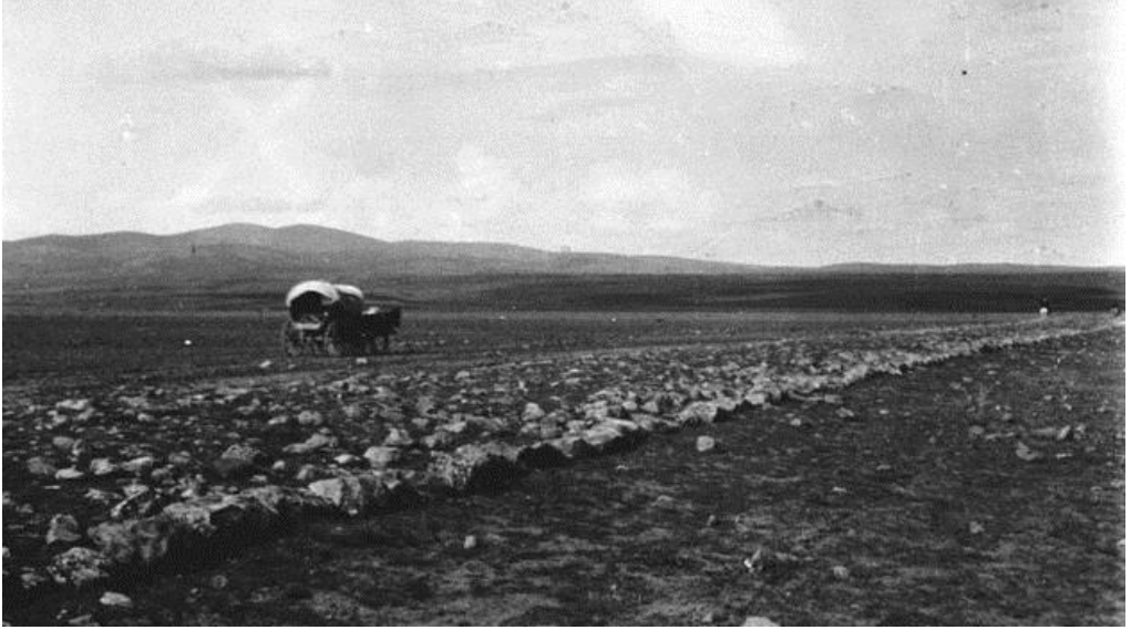
Foto 18. Kızılören yakınında Via Sebaste (Ulu Yol) denilen Roma Yolu (Gertrude Bell Archive,1907).

Araştırma sahasının ulaşım bakımından tarihi önemini gösteren bir başka unsur da Kızılören (Yazı Önü) Hanı'dır. Bilindiği gibi Türkiye Selçuklu Devleti döneminde işlek ticaret yolları üzerinde kervanların güvenli bir şekilde konaklamaları ve ihtiyaçlarını karşılamaları için kervansaray (kervan hanları) yaptırılırdı. Kızılören Hanı, boğazın doğu tarafında, aynı adla anılan ovanın üzerinde, Konya'ya yaklaşık 40 km uzaklıkta, tarihi yolun güney kenarında Sultan I. Gıyaseddin Keyhüsrev döneminde Emir Kandemir tarafından 1206 (603)'da inşa ettirilmiştir (Foto 19). Mimarı hakkında bir bilgi yoktur. Konyalı, Sultan Keyhüsrev'in Konya - Beyşehir yoluna büyük bir önem verdiğini kaydeder. 84 Aynı konuda Sterrett de, yol boyunca aralıklarla metruk ve yıkık hanların varlığını, Selçuklu Sultanları döneminde Antiochia Pisidia (Yalvaç) ile Iconium (Konya) arasında oldukça yoğun bir trafiğin yaşandığının göstergesi olarak değerlendirir. 85 Aynı sayfada Sterrett, (Şarki) Karaağaç'tan Konya'ya giden bu yüksek yol, her zaman ve özellikle son birkaç yıl içinde zeybek soyguncuları ile istila edildi demektedir. Yöre halkı da özellikle Bağırsak Boğazı'nın en dar kesiminde gerçekleştirilen benzer soygun hikâyelerini anlatmaktadır.