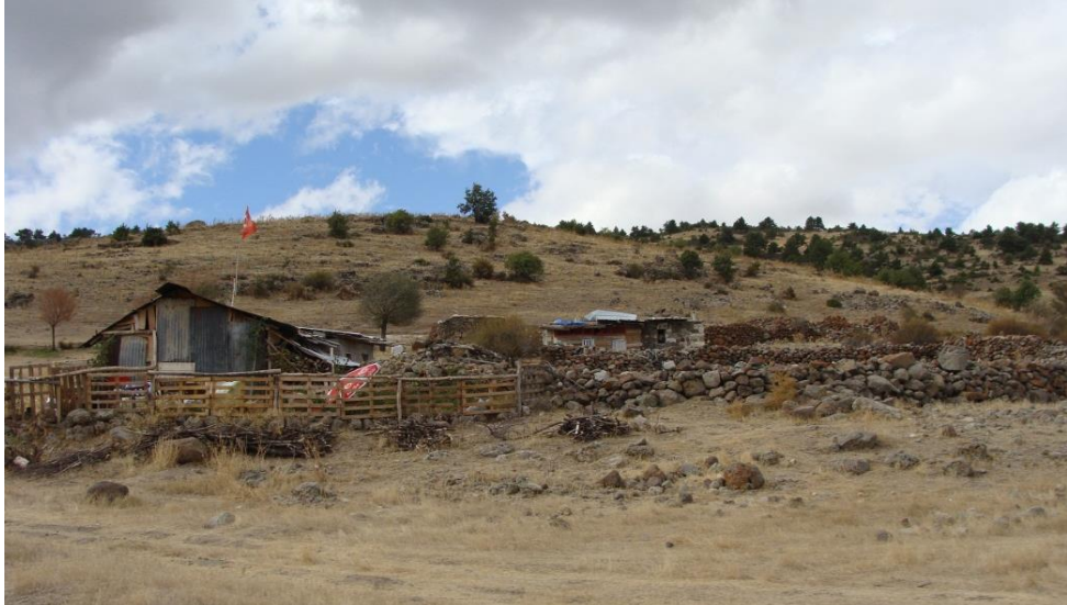
Foto 13. Yamasökendamları Mevkii'nde yakın dönemde inşa edilen evler.

Günümüzde Meram ilçesi Sağlık köyünün sınırları içinde kalan Yamasökendamları yakın zamanda yeniden yerleşime açılmıştır. 2010'da iki hanenin bulunduğu yerleşmede bugün hayvancılıkla uğraşan 4-5 hane meskûn durumdadır (Foto 13, 14). Genellikle engebeli, taşlık ve ormanlık olan arazide çok sınırlı ölçülerde zirai faaliyetler de yapılmaktadır. Ziraat alanları Arpalıgedik Dere'nin vadisinde, İlet Pınarı'nın doğu ve güneyine tekabül etmektedir.