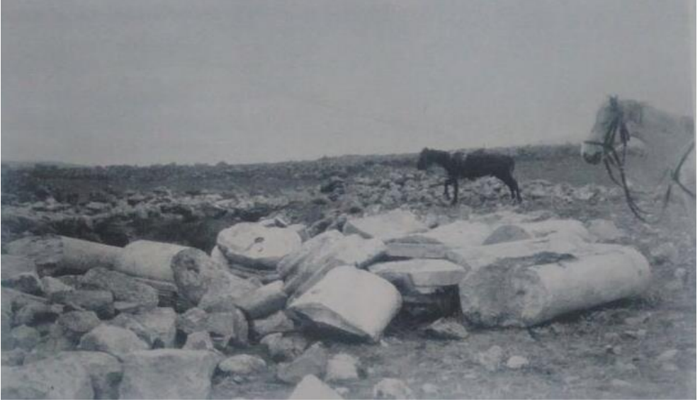
Foto 1. Kızılören Hüyük Tepe'de çıkarılan bazı kalıntılar (Swoboda ve diğerleri, 1935, s.105).

olmuştur. Bu sütun düz, yuvarlak yarı sütunlar ve aradaki, basit süslemeli koruyucu çemberleriyle 3' 225 m yüksekliğinde bir çiftli sütun izlenimi vermektedir (Foto 1). Muhtemelen bu noktada var olan bir Hıristiyan kilisesine 10 direk olarak hizmet etmiştir." 11 Hüyük Tepe'nin buna benzer bazı özelliklerine daha önce yayınlanan başka bir eserde de kısaca temas edilmiştir. 12