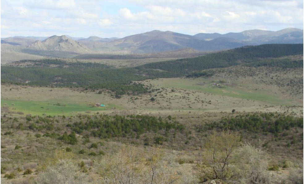
Foto 15. Bağırsak Boğazı'nın güneyinde yaklaşık 1600 m'lerde yer alan yaylalardan bir görünüm.

Araştırma sahasında tespit edilebilen başlıca yaylalar şunlardır; Bağırsak Boğazı'nın güneyinde Bakırlıdere (1340 m) 70 , Dudu (1330 m), Aşağıörtülü (1350 m), Yukarıörtülü (1450 m), Ömerşık (1550 m), Alıçlı (1600 m), kuzeyinde Körteller (Körkahya, 1360 m), Derbentteke'nin kuzeyinde Olukboğazı (1550 m), Kale Tepesi'nin kuzeybatısında Asar (1550 m), kuzeyinde Ballıkaya (Balkaya, 1510 m), kuzeydoğusunda Oluk (1700 m), Aladağ kütlelerinin güney yamaçlarında Erikli (1650 m), Kalkıyan (1600 m), Gebeş (1750 m), Cevizli (1550 m), Çeşmebaşı (1520 m), Başmakçı (1550 m), Kültü (1700-1750 m), Kızılören'in güneybatısında Aşağı Sorkun (1390 m) ve Yukarı Sorkun (1420 m), Sağlık köyünün güneydoğusunda Pınarcık (1550 m), güneyinde Gavurharmanı (1520 m), Sağlık köyünün güney-güneybatısında bugün devamlı bir yerleşme haline gelen Gölcük (1600 m) yaylasıdır (Foto 15, 16). Bir kaynakta Kızılören civarında 30 kadar yaylanın olduğu belirtilir. Nitekim bunlar arasında Kale, Aşağı Bağırsak, Yukarı Bağırsak, Kazlar (Gaziler), Kurusöğüt, Karabardak, Susuzkuyu, Kolcuların, Taşpınar ve Kavaköreni gibi yaylalar yer almaktadır. 71