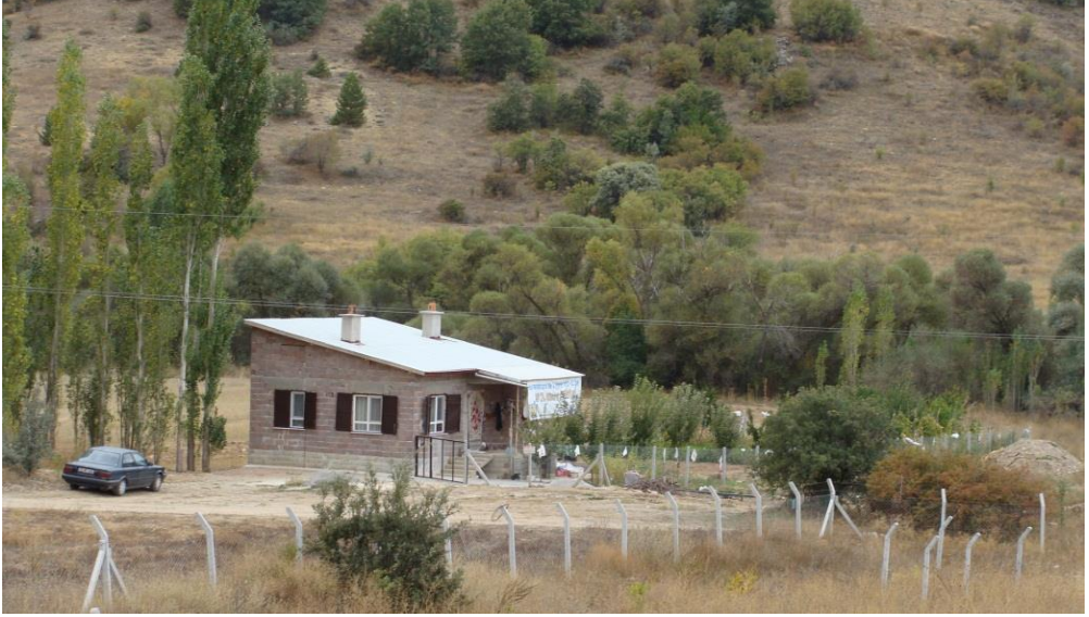
Foto 17. Bağırsak Boğazı'nda rekreasyon amaçlı yakın zamanda inşa edilen modern bir bahçe evi.

Araştırma sahasında son yıllarda ziraat alanlarında sayısı artan bahçe evleri dikkati çekmektedir. Bunlardan rekreasyon amaçlı ve modern şekilde inşa edilenlerinin yaygınlaşma eğiliminde olduğu tespit edilmektedir (Foto 17). Özellikle Kızılören, Bağırsak Boğazı ve yakın çevresinin ana yol güzergâhında, Konya'ya 40-50 km, başka bir deyişle yaklaşık 45-50 dakika uzaklıkta konumlanmasının bunda önemli bir rol oynadığı söylenebilir. Bahçe evleri ise daha çok Sağlık köyünde sulamalı tarımın yapıldığı Hüyük Tepe'nin güneydoğusundaki ova sahalarında yaygınlık kazandığı görülür. Bozyiğit ve Güngör, Sağlık köylülerinin Mart-Nisan aylarında bahçe evlerine gelerek tarım faaliyetlerinde bulunduğunu ve Eylül-Ekim aylarında da tekrar köylerine geri döndüklerini belirtmektedirler. 77