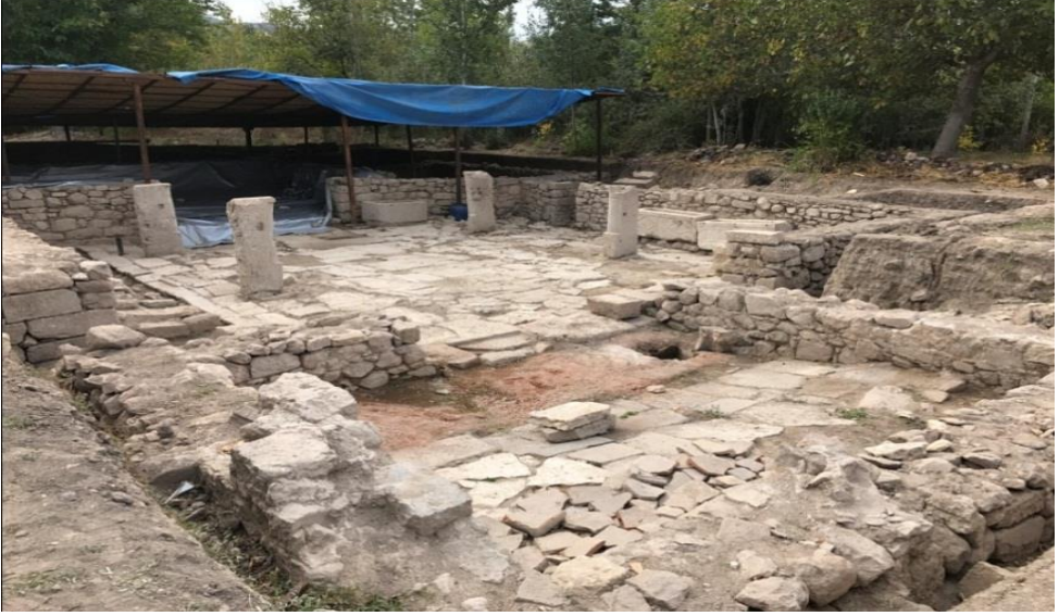
Foto 7. Yunuslar'daki arkeolojik çalışmalar (2017), burada kadim bir şehrin varlığını gösterir.

Yunuslar köyü yakın dönemde bahçeler içinde nispeten gevşek bir yerleşme dokusu kazanmıştır. Köy, Bağırsak Çayı vadisi ile doğu tarafında yer alan muhtemel bir höyük tepenin eteğinde iken yakın zamanda ulaşımın etkisiyle karayoluna doğru gelişme göstermiştir. Hatta karayolunun batısında da yaklaşık 25 haneden oluşan yeni bir yerleşme nüvesi gelişmiştir. Köy konutları genellikle bir-iki katlı olmakla birlikte az sayıda 3 katlı örnekler de mevcuttur. Köyün nüfusu 1960 sayımında 546, 1980'de 458 iken 2016 yılı adrese dayalı kayıt sistemine göre 191'e inmiştir. Bu istatistik veriler itibariyle köyün göç verdiği ve nüfusun önemli miktarda azaldığı dikkati çekmektedir.