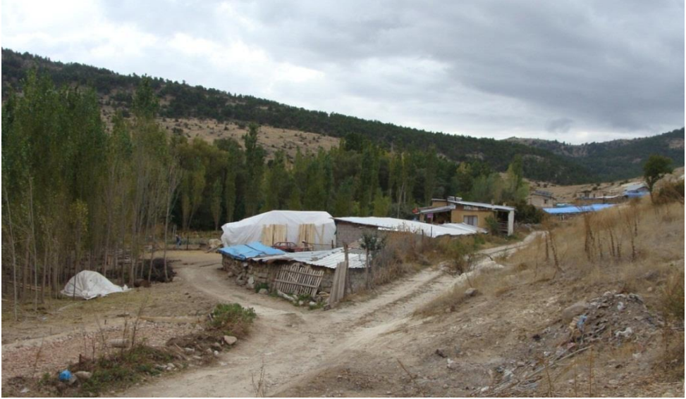
Foto 16. Bağırsak Boğazı'nın güneyinde Bakırdere vadisinde yer alan Bakırdere Yaylası.

Araştırma sahasında bulunan yaylaların birçoğu halen kullanılmakta ve geleneklerini büyük ölçüde sürdürmektedir. Fakat bazı yaylalar zamanla terk edilmişlerdir. Aşağıörtülü ve Yukarıörtülü yaylaları buna örnek verilebilir. Yaylalarda genellikle hane sayısı fazla değildir. Birçok yaylada hane sayısı 5'in altındadır. Bununla birlikte bazı yaylalarda; örneğin Asar ve Kültü yaylasında hane sayısı 8-10 civarındadır. Yaylaların yükselti değerleri de farklılıklar arz etmektedir. 1300 m'lerden başlayıp 1800 m'lere ve hatta Aladağ (2339 m)'ın araştırma sahasının biraz dışında kalan daha yüksek kesimlerine doğrudan dağılışı gösterir. Günümüzde yaylacılık faaliyetine katılanlar yaş grubu itibariyle çoğunlukla orta ve yaşlı kuşaktan oluşur. Ayrıca araştırma sahasında turizm amaçlı yayla kullanımının henüz gelişmediği de ifade edilebilir.