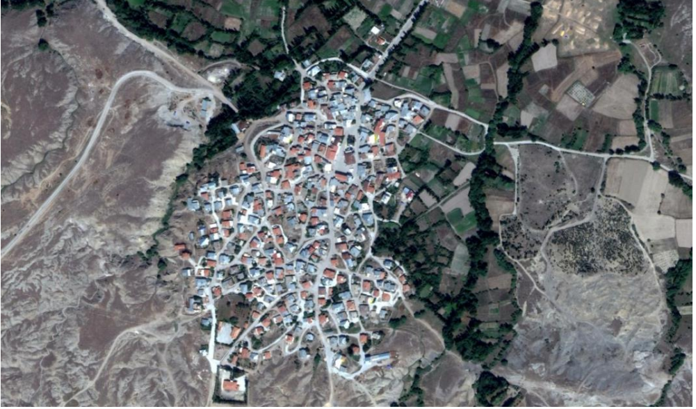
Foto 10. Sağlık, ovaya doğru uzanan bir sırtın üzerinde plansız gelişmiş sık dokulu eski bir yerleşmedir.