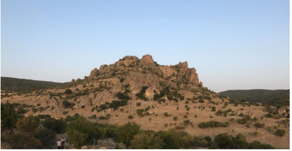
Foto 2. Kale Tepe'nin rölyefi doğal yapısını büyük ölçüde korumuştur. Fotoğraf güneybatıdan alınmıştır.

ve uzun merdivenli kuyu 23 , yine kayaya oyulmuş aslan figürü ve kalenin çevresinde yerleşmenin varlığını yansıtan çok sayıda izler günümüze gelebilmiştir (Foto 3). Bunlardan başka Swoboda ve diğerlerinin verdiği bilgiye göre, Kale Tepe'nin zirvesinde oranın yerlileri tarafından yapılan (kaçak) kazılar sonucunda çapları 0.10 ile 0.35 m arasında değişen yaklaşık 500 adet taş mancınık güllesi çıkarılmıştır. 24 Başka kaynaklardan bu güller hakkında daha ayrıntılı bilgilere ulaşmak mümkün olmamıştır.