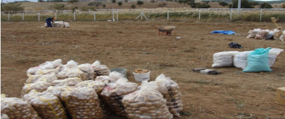
Foto 9. Kızılören ve Sağlık köylerinde havza tabanında yer yer patates ekim alanları görülür.

Konya'nın Meram ilçesine bağlı olan yerleşme, Kızılören havzasının güneybatı kısmında, 1400-1450 m eşyükselti eğrileri arasında, küçük bir ovanın kenarında, kuzey-kuzeydoğuya doğru eğimli yamaçlar üzerinde kurulmuştur. Bağırsak Boğazı'nın girişinin güneydoğu tarafında bulunan ve eski adı Ağrıs (Ağras, Agos) olan köy, Kızılören havzasında yer alan önemli yerleşmelerden birini oluşturur. Köyün kuruluşu oldukça eski tarihlere gitmektedir.