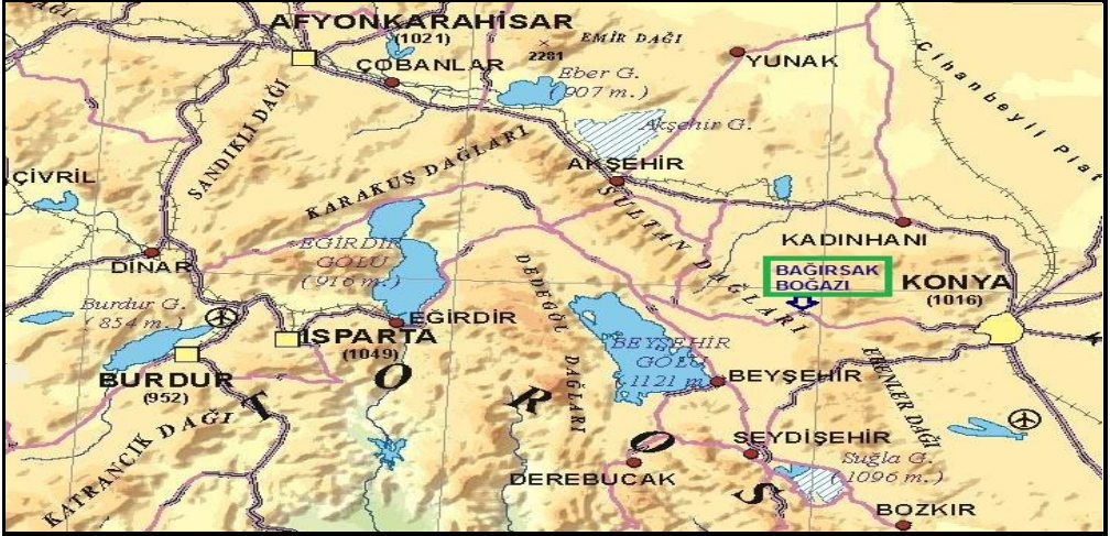
Harita 1. Araştırma sahasını oluşturan Bağırsak Boğazı ve yakın çevresinin lokasyonu.

Bağırsak Boğazı'nı oluşturan ve aynı adla anılan akarsudan bazı eserlerde Çoka Suyu olarak bahsedilir. Nitekim akarsuyun Kızılören tarafından aldığı ilk tabilerin birleşmesiyle oluşan kolu, 1: 200.000 ölçekli haritanın Konya paftasında (Harita Genel Müdürlüğü, 1945) Çoka Suyu adıyla kaydedilmiştir. Akarsuyun bu kolu, Kızılören'in yanında Çoka Suyu adı verilen bir kaynaktan beslenir ve bu kaynağın adı alır. Fakat Çoka Suyu'nun günümüzde fazla su kullanımı nedeniyle Bağırsak Çayı'na ulaşmadığı görülür. Yörede Çoka adını taşıyan başka akarsu ve yayla gibi coğrafi unsurlar da bulunur. Türkçe sözlüklerde Çoka; tarla ve bağlardaki taş yığını anlamına geldiği kaydedilir. Gerçekten de Bağırsak Boğazı, Kale Tepe (Yunuslar'da) ve Sağlık Köyü civarında Neojen yaşlı trakit ve andezitlerin yaygın bulunduğu engebeli alanlarda topografya yüzeyinin farklı büyüklükte köşeli volkanik kayalarla kaplı olduğu gözlenir. Yani buralarda arazi taşlıktır. Genellikle otlak şeklinde faydalanılan arazinin bazı yerlerinde taşlar toplanarak oluşturulan küçük alanlarda tarım yapılır. 4