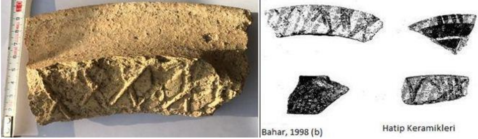
Foto 4. Kale Tepe’de bir kabinin ağız kenarındaki çapraz boyalı bezeme. Sağdaki Hatip Kalesi’ne aittir.

Volkanik kökenli tarihi Kale Tepe’ye farklı isimler verilmiştir. Üzerinde bir kalenin bulunması nedeniyle 1: 25.000 ölçekli haritanın Konya M28-a1 paftasında Kale Tepe, örneğin 1912 yılında basılan Kiepert’in haritası 29 gibi birçok yayında Asar Tepe adı verilir. Bunlardan başka, Osmanlı Arşivi’nde bulunan 30 Haziran 1908 tarihli bir belgede: “Konya merkez kazasına merbut Kızılviran karyesinde vaki Hisarkale nam harabe ile civarındaki arazi-i vesiaya...” 30 kaydedildiği üzere Hisarkale adıyla söz edilir. Smbat Sparapet’in kroniğinin Fransızca çevirisinde Meldinis 31 adıyla zikredilen kalenin adı, eserin İngilizce çeviri nüshasında Melitene 32 , Osmanlı arşiv belgelerinde Hisar-ı Meldos; Karye-i Hisar-ı Meldos; Hisarkale şeklinde geçer. Günümüzde ise Kale Tepe veya Balkaya diye söz edilir.