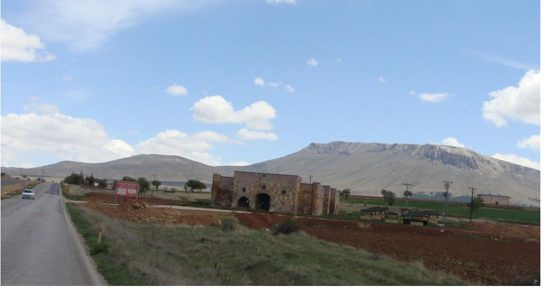
Foto 19. Kızılören Yazı Önü Hanı, 12. yüzyılda yolun ticari önemini ve trafik yoğunluğunu yansıtan önemli bir yolboyu tesisidir. Yaklaşık 8 asırdan beri bu işlevini sürdürmektedir.

Kızılören Yazı Önü Hanı konaklama tesisinin büyüklüğü (Konya- Beyşehir arasındaki hanların en büyüğü), Beyşehir- Konya ve Konya- Yalvaç yollarının yanı sıra Bağirsak Boğazı'nın da ulaşım bakımından önemi ortaya koyan önemli bir göstergedir. Araştırma sahasında bu handan başka hanlar da vardır.